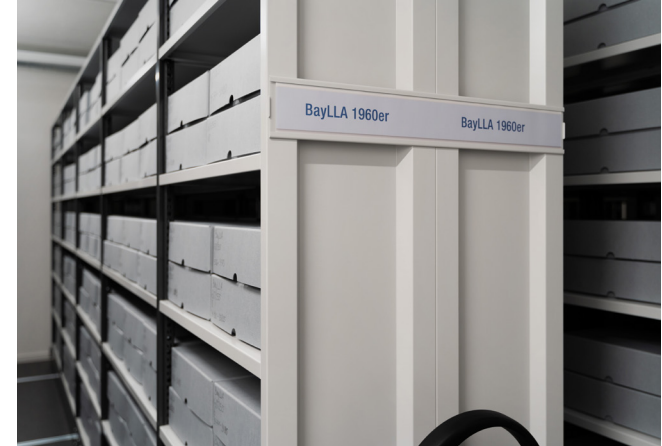
Blick in das Archiv in Neustadt a.d.Aisch

Das Bayerische Landesluftbildarchiv besitzt eine einzigartige Sammlung von über einer Million Luftbildern von ganz Bayern. Es zählt zu den größten Luftbildarchiven in Deutschland. Die ältesten Aufnahmen stammen aus den 1920er Jahren, die neuesten Luftbilder aus der aktuellen Bayernbefliegung.