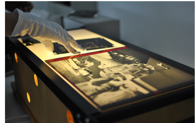
Luftbild-Negativ auf dem Leuchttisch

Das Archiv wurde 1975 bei der Bayerischen Vermessungsverwaltung eingerichtet. Im Rahmen der Heimatstrategie Bayern wurde das Luftbildarchiv 2018 nach Neustadt a.d.Aisch verlagert. Hier werden die analogen Luftbilder aufbewahrt, die digitalen werden in München gespeichert.